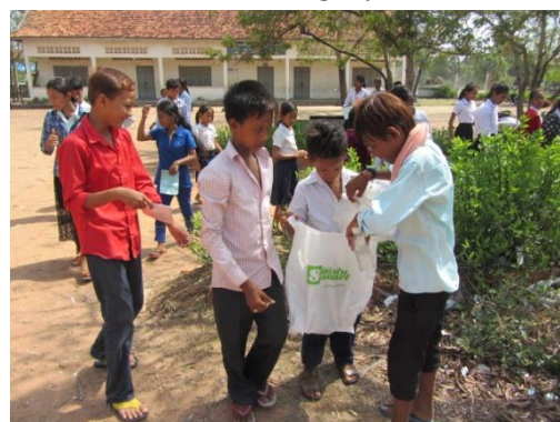
Les enfants de l'école de Prey Khla s'occupent du nettoyage du terrain de l'école

Association Angkor-Belgique asbl Rue Julie Billiard 12/5 5000 Namur