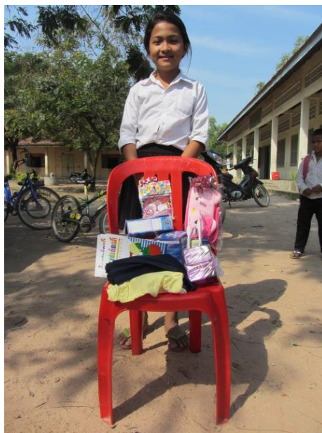
à Tonle Bati,