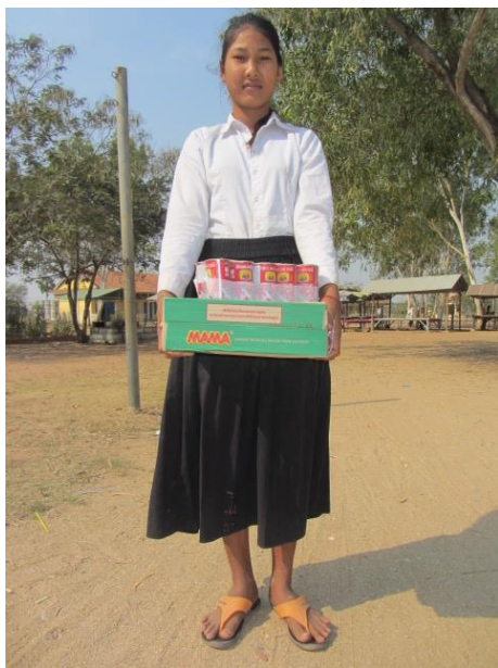
à Prey Khla,