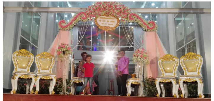
Hong était parmi les invités et nous a fait parvenir quelques photos