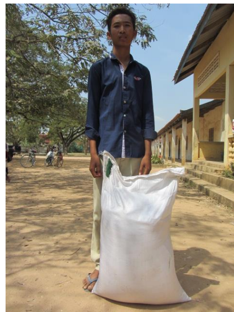
et à Chambak Bitmeas