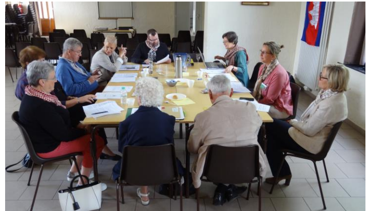
L'AG a eu lieu avant la réunion des parrains

Un échange de questions-réponses et d'intéressantes suggestions des parrains et marraines ont clôturé la partie informative de la réunion, qui fut suivie d'un goûter très convivial. Rendez-vous dans deux ans.