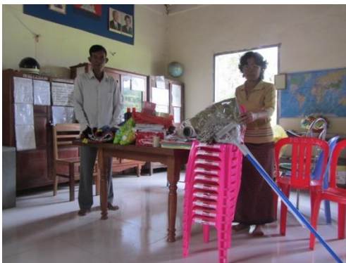
à Tonlé Bati,