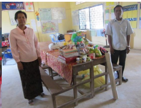
à Chambak Bitmeas,