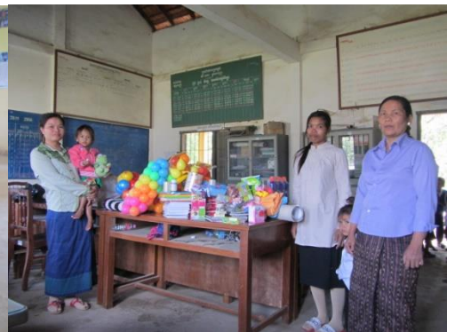
et à Prey Khla