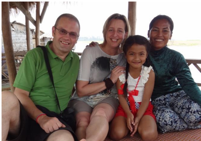
La 1 ère rencontre en 2015