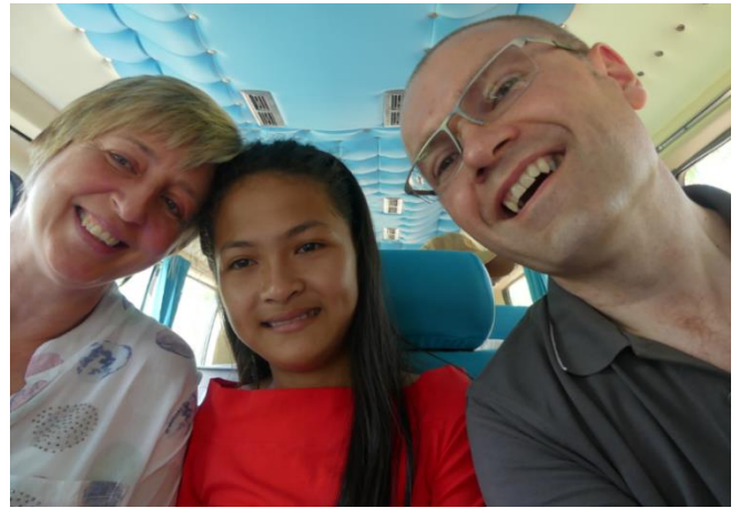
La 2 ème en 2018

sortons du minibus d'AAB et immédiatement elle nous saute dans les bras, tout comme sa maman plus tard. L'émotion est vive... Malgré la barrière de la langue, on se comprend et on se dit que notre aide n'est pas vaine. La fin de journée arrive et le départ s'annonce, les larmes coulent. Mais déjà on se dit : quand revenons-nous ?