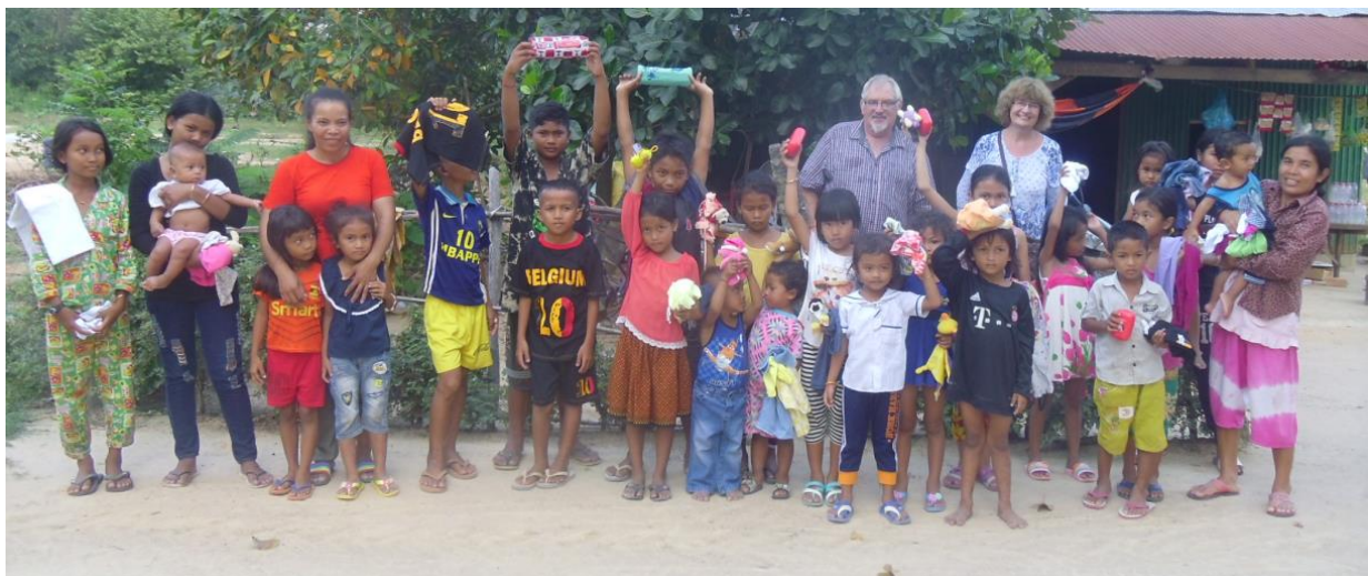
Entourée des autres enfants du village après la distribution des cadeaux